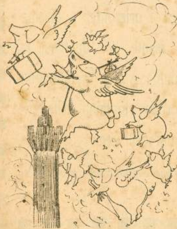
Volano i porci dal desio portati D'esser in altri lidi ancor mangiati.

Direttore responsabile Guido Podrecca. Bologna 1889 — Stab. Tip. Succ. Monti