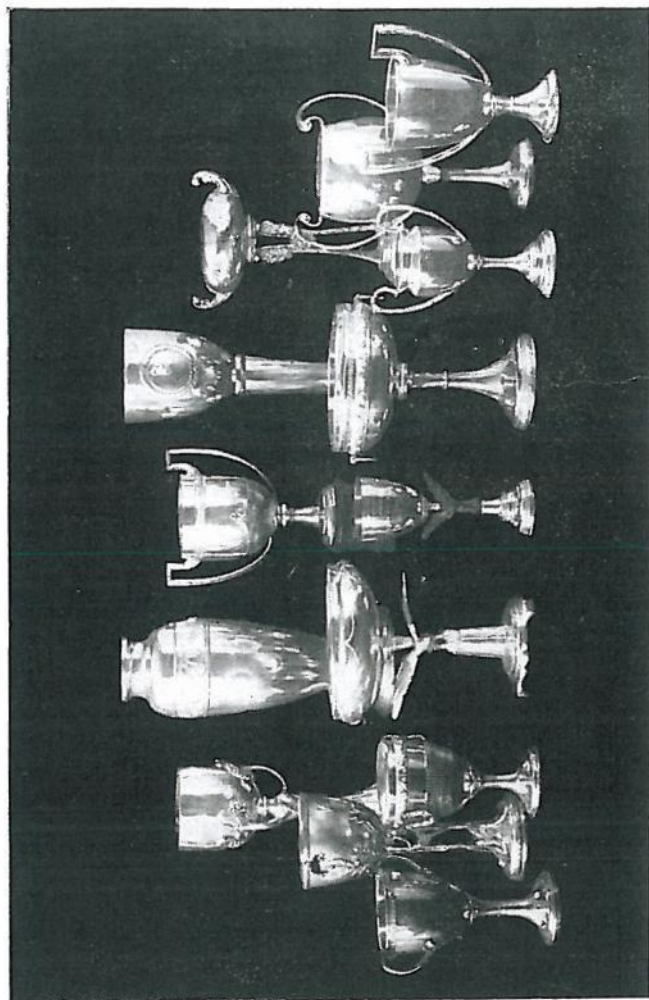
ALCUNE DELLE COPPE MESSE IN PALIO PER IL CONVEGNO