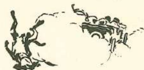
UN CANE SCHIACCIATO