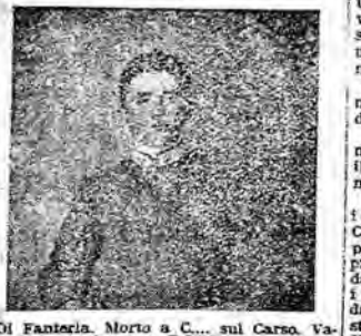
Di fanteria. Morto a C... sul Carso. Valorosissimo giovane affabituato a pieno di affetto per la famiglia e gli amici.