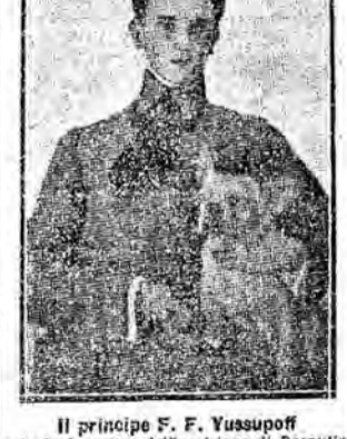
Il principe F. F. Yussupoff

Rasputin nel suo vagabondaggio avrà certamente sperimentato l'efficacia di un certo linguaggio e s'improvvisò un fortunato predicatore e banditore delle beatitudini esteriori che spettano alle virtù cristiane.