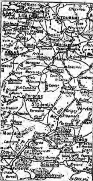
Il bollettino inglese