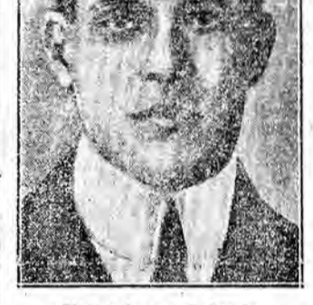
Alessandro re di Grecia

Commenti e impressioni sull'imposta abdicazione vava proposto la detronizzazione di Re Costantino dal 6 dicembre scorso e dovette rinunciare innanzi alla obiezione che le circostanze non vi si prestavano, soprattutto perché le truppe reali erano allora troppo numerose in Atene. La seconda è questa: la soluzione del problema greco non ha per nulla connessione alcuna con la rivoluzione russa.