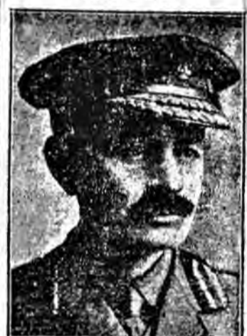
vincitore della battaglia di Bois Bourion

Il comunicato ufficiale della sera 15 dice: Nella regione di San Quentin raspingiamo rapidamente due campi di artiglieria, 16 e 17, in parte artiglierie, operanti ad ovest di Fuhre e nella regione di Samogneux. Ricordate che in questa zona sono stati abbattuti tre aeroplani nemici, e che gli altri due sono ancora in vista.