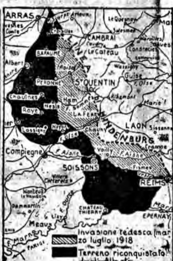
Linea di Hindenburg