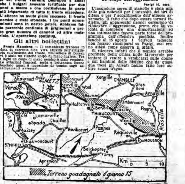
Il terreno guadagnato il giorno 15

Parigi 16, sera. L'incursione aerea di stanotte è stata una delle più notevoli per l'intensità dei tiri di difesa e per l'accanimento dell'attacco avversario. Il fatto che dopo essere tornati indietro, gli apparecchi nemici cercarono di rinnovare l'aggressione, prova che la volontà di compiere una dimostrazione ed una intimidazione faceva parte forse del programma dell'offensiva pacifista. Inoltre benché gli aerei tedeschi non fossero ricomparsi su Parigi, essi erano attesi come osserva il Matin. Si riteneva infatti che il nemico avrebbe profitato della prima notte favorevole per tentare di venire a vendicarsi sulle donne e sui bambini delle distrette che da quasi due mesi gli Alleati hanno fatto loro subire senza tregua.