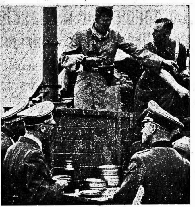
Il Führer fra i soldati in Polonia assiste alla distribuzione del rancio