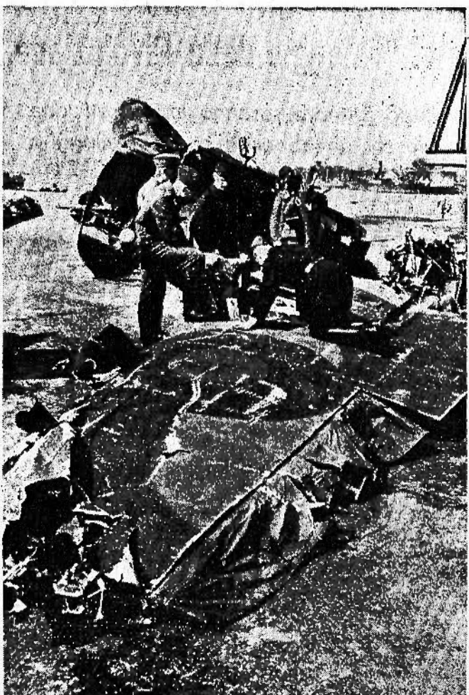
Soldati tedeschi che esaminano le parti d'un apparecchio inglese abbattuto durante l'incursione sul porto di Wilhelmshafen

olite, gli apprestamenti di difesa, brincoramenti, fortificazioni, zone difese, centri di rifornimento delle retrovie, specialmente nella zona del Corridoio e più tardi nella vasta zona della Vistola, del Narew, del Bug e della Slesia, sono state studiate e rilevate particolarmente e le informazioni raccolte, come anche i rilievi fotografici compiuti sono stati preziosi per il Comando tedesco ai fini dello sviluppo delle operazioni.