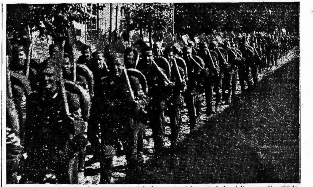
Dietro le truppe tedesche che avanzano in Polonia, seguono i lavoratori che riattano ponti e strade. Ecco una colonna del Servizio del lavoro sulla strada verso Lódz.

La resa intimata a Varsavia Berlino, 16 settembre Il D.N.B. comunica: «Questa mattina parlarono tedeschi, che alle 8,30 si erano presentati alla linea polacca presso Varsavia per intimare la resa della città.»