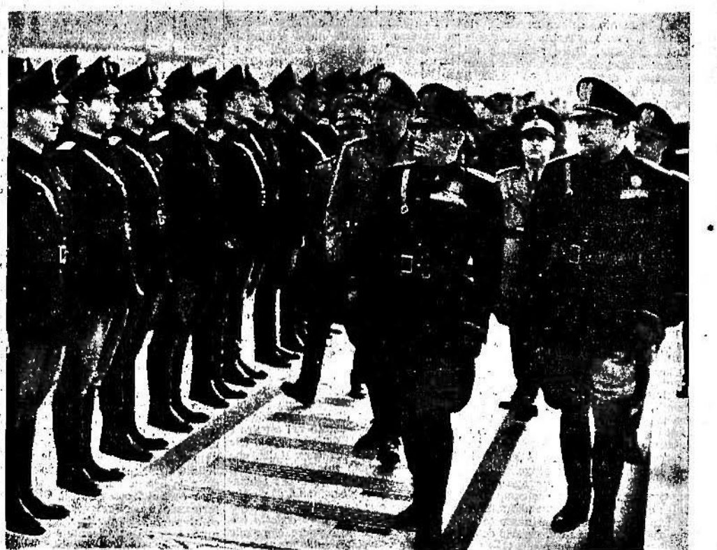
Il Duce, accompagnato dal Segretario del Partito e dal Ministro Grandi, passa in rassegna al Foro Mussolini i 300 uditori giudiziari che frequentano il Corso di preparazione politica.