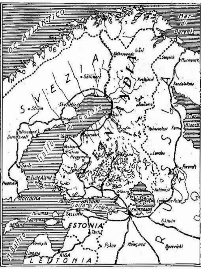
La Finlandia, non è famosa nel mondo soltanto per i 60 mila laghi, ma per il fatto che sta fra i Paesi privi di snalfabeti e fra i più istruiti del mondo...

Roma, 29 novembre. E' molto facile dipanare la matassa delle controversie tra Russia e Finlandia, avvertendo innanzi tutto che la Finlandia, anche sotto la Russia, quando era un Granducato, viveva come uno Stato autonomo: soltanto la politica estera e le rappresentanze diplomatiche erano russe.