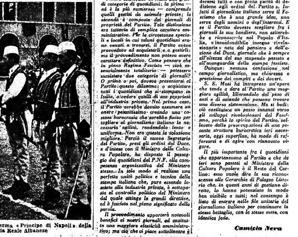
La consegna a Roma nella Caserma «Principe di Napoli» della bandiera alla Guardia Reale Albanese

Veramente imponente è il complesso delle opere pubbliche di questi ultimi due anni, ed sopra tutto per la grande mole dei lavori richiesti dalla attuazione dei