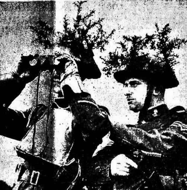
GLI INGLESI SULLE PRIME LINEE - Una pattuglia di graduati con l'armamento completo (frasci sull'elmetto, binocolo, maschera antigas e pistola) osserva allo scoperto e con calma le posizioni nemiche.

Oggi si apprende anche la straordinaria storia della nave tedesca Borkum, che è stata affondata da un sommergino tedesco.