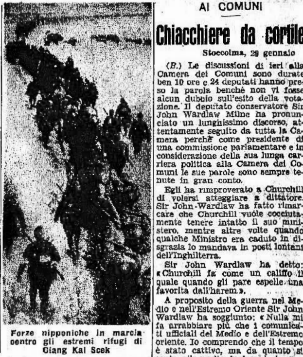
Forze nipponiche in marcia contro gli estremi rifugi di Giang Mai Soek

Negli ambienti politici e tra il pubblico ungherese la notizia della riconquista di Bengasi, rapidamente diffusa, ha suscitato un grande entusiasmo. Tutti i giornali usciti a tarda sera danno grande rilievo tipografico alla vittoriosa azione italiana e pubblicano sotto amplici titoli il testo del comunicato ufficiale relativo all'entrata delle nostre truppe nella capitale della Cirenaica.