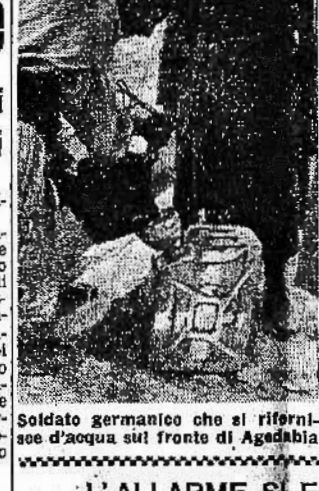
Soldato germanico che si rifornisce d'acqua sul fronte di Agadabia