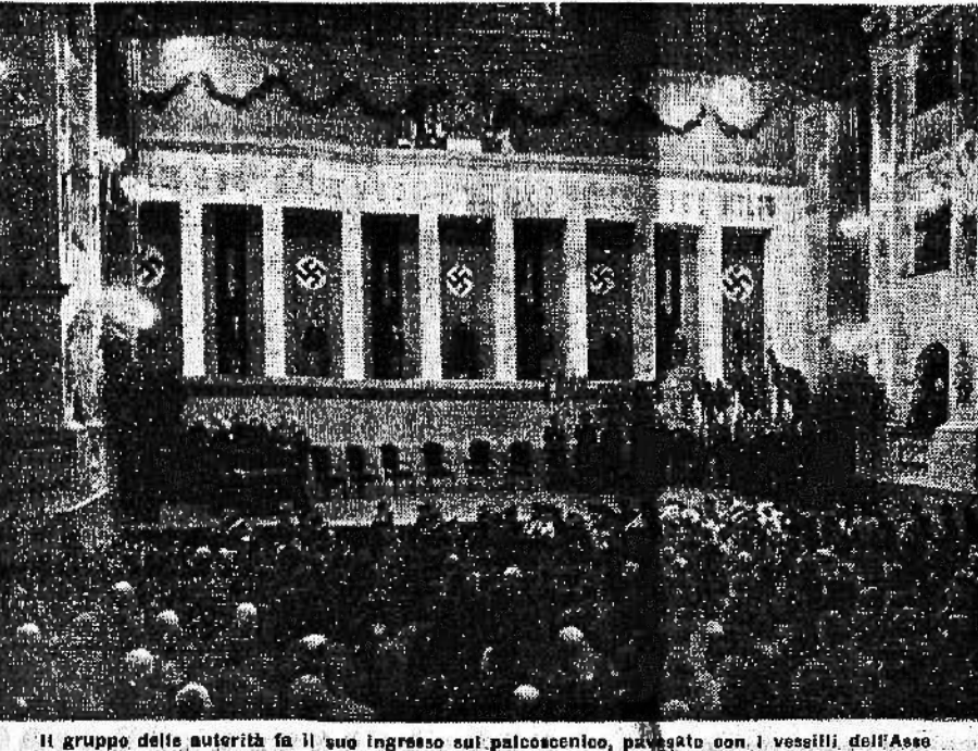
Il gruppo delle autorità fa il suo ingresso sul palcoscenico, preceduto dai vessilli dell'Asse