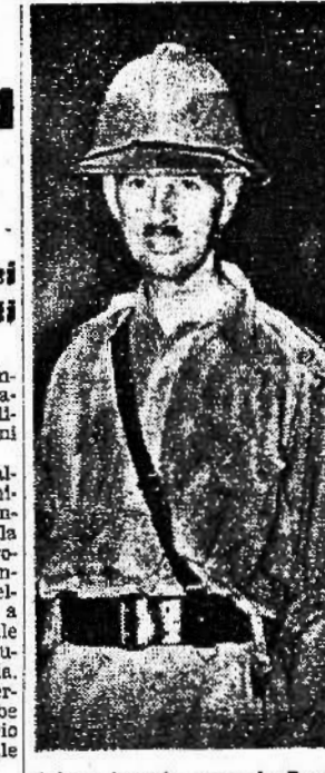
Il luogotenente generale Perovai, il vinto di Singapore costretto dai giapponesi alla resa a discrezione...