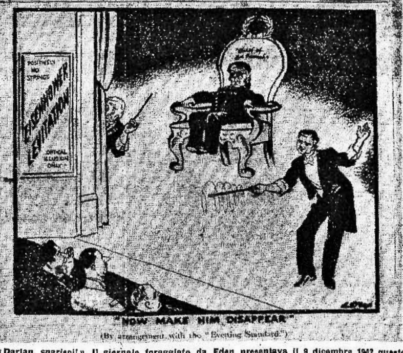
Darlan, sparisci! Il giornale foraggato da Eden presentava il 9 dicembre 1942 questo «Darlan, sparisci!» che il Ministro degli Esteri con il concorso di Hudson preparava ad eseguire.

THE MANCHESTER GUARDIAN, WEDNESDAY, DECEMBER 30, 1942