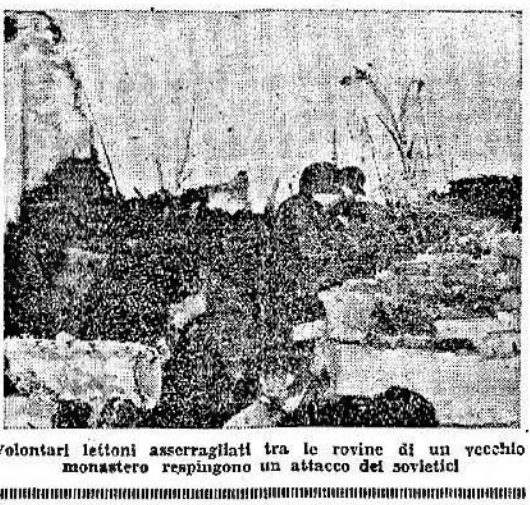
Volontari lettoni asserragliati tra le rovine di un vecchio monastero respingono un attacco dei sovietici