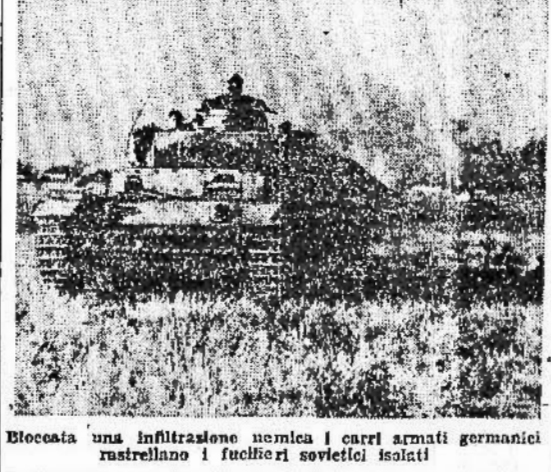
Bloccata una infiltrazione nemica i carri armati germanici rastrellano i fuociferi sovietici isolati