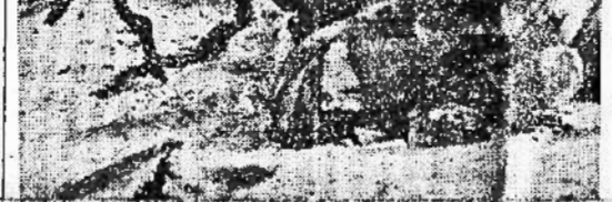
Posizione difensiva tedesca nel settore di Leningrado in azione contro le colonne attaccanti

Soppressione delle decorazioni guadagnate nella guerra di Spagna - Autori di un movimento per la rinascita del Fascismo in Sicilia condannati a morte Roma, 18 gennaio Badoglio ha rinviato la commissione di rappresentanti del partito democratico, della quale egli intendeva valersi per sostenere la sua non troppo salda posizione. I componenti la commissione gli hanno fatto presente la critica situazione dei lavoratori dopo la soppressione delle organizzazioni sindacali. Qualche ora fa è stato sottoposto che il risentimento verso il governo badogliano era aumentato dopo di avere appreso la notizia della soppressione delle decorazioni guadagnate nella guerra di Spagna.