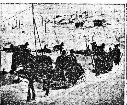
Pure tra i rifugiati dell'inverno nordico afflucarono sullo slitte i rinforzi e i rifornimenti sul fronte careliano

Lisbona, 21 gennaio. La censura anglo-nordamericana ha liberato finalmente, a quanto riferisce l'agenzia Reuters, una corrispondenza di un inviato di guerra britannico dell'Italia meridionale sull'attacco aereo compiuto nella notte del 20 gennaio scorso anno da aerei tedeschi contro il porto di Bari. La corrispondenza conferma che due navi cariche di munizioni vennero colpite e quindi splinterate in aria, provocando l'affondamento di altre quindici navi. Oltre mille uomini dei componenti gli equipaggi perirono a seguito del bombardamento e molte costruzioni furono distrutte. Nove corrispondenti di guerra britannici alcune ore dopo introno la loco di varie gigantesche esplosioni.