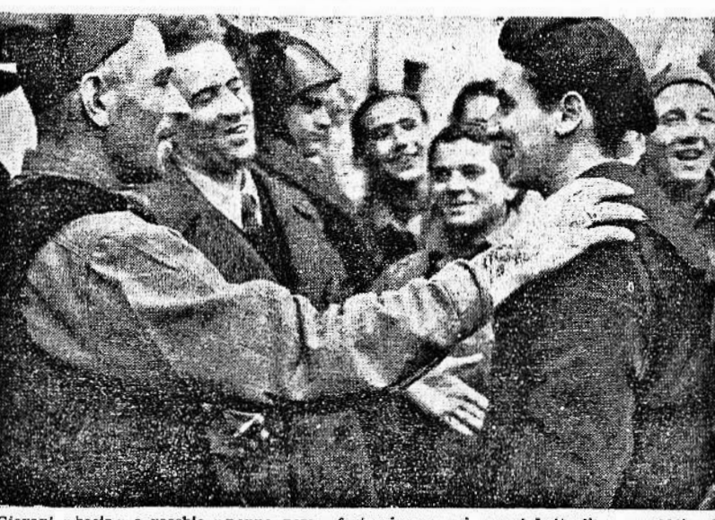
Giovani «bocci» e vecchie «penne nere» fraternizzano nei nuovi battaglioni repubblicani che si apprestano al combattimento

Il sanguinoso sacco delle forze di Alexander A ventisei giorni dallo sbarco anglo-americano sulla costa pontina, la situazione per il nemico germanico, come ha ricordato il corrispondente ufficio di radio Londra, quanto mai nebulosa e ricca di incognite. Lo svolgimento dei movimenti di questi ultimi giorni ha invece dimostrato un dato di fatto incontrovertibile e cioè che l'avventura di Nettuno è diventata per gli alleati un grave, continuo salasso.