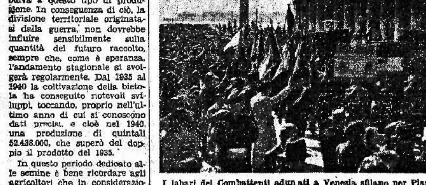
I labori dei Combattenti adunati a Venezia sfilano per Piazza S. Marco

L'augmento delle remunerazioni e del concorso nelle spese di trasporto. Roma, 8 aprile.