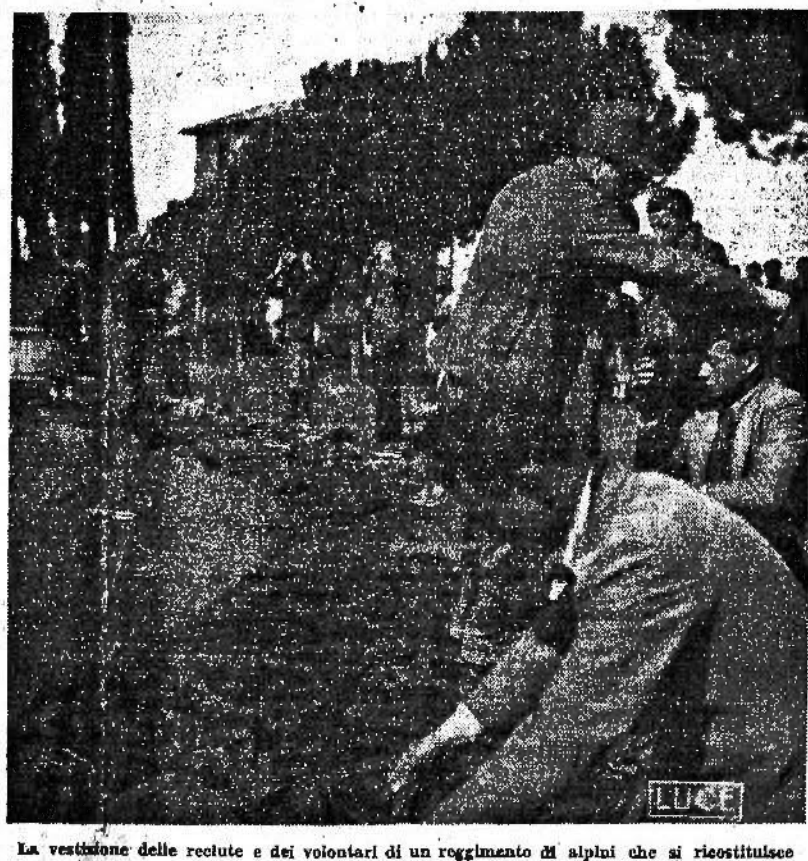
La vestizione delle reclute e dei volontari di un reggimento di alpini che si ricostituisce

X, 31 marzo Il Quar generale delle Forze Aeree repubblicane comunica data 30: Ieri marzo caccia italiani ha intercettato nei cieli di Lombardia e del Piemonte formazioni di velivoli bersari, abbattendo, portante la forte superiorità nemica, quattro velivoli dei quali due quimotori e due caccia. Itri tre velivoli sono considerarsi probabilmente abbattuti. Un quadrimotore nemico è stato abbattuto su un nostro aereo; l'equipaggio non catturato. Un nostro pilota, segnalato come perso nel comunicato del giorno 29, si è invece salvato sul paracadute. Nei combattimenti svoltisi nei cieli del Veneto, di cui al comunicato del 29 corrente, furono abbattuti altri due apparecchi da caccia, successivamente artati. Il numero complessivo degli apparecchi non abbattuti nei cieli del Veneto è così salito a 20.