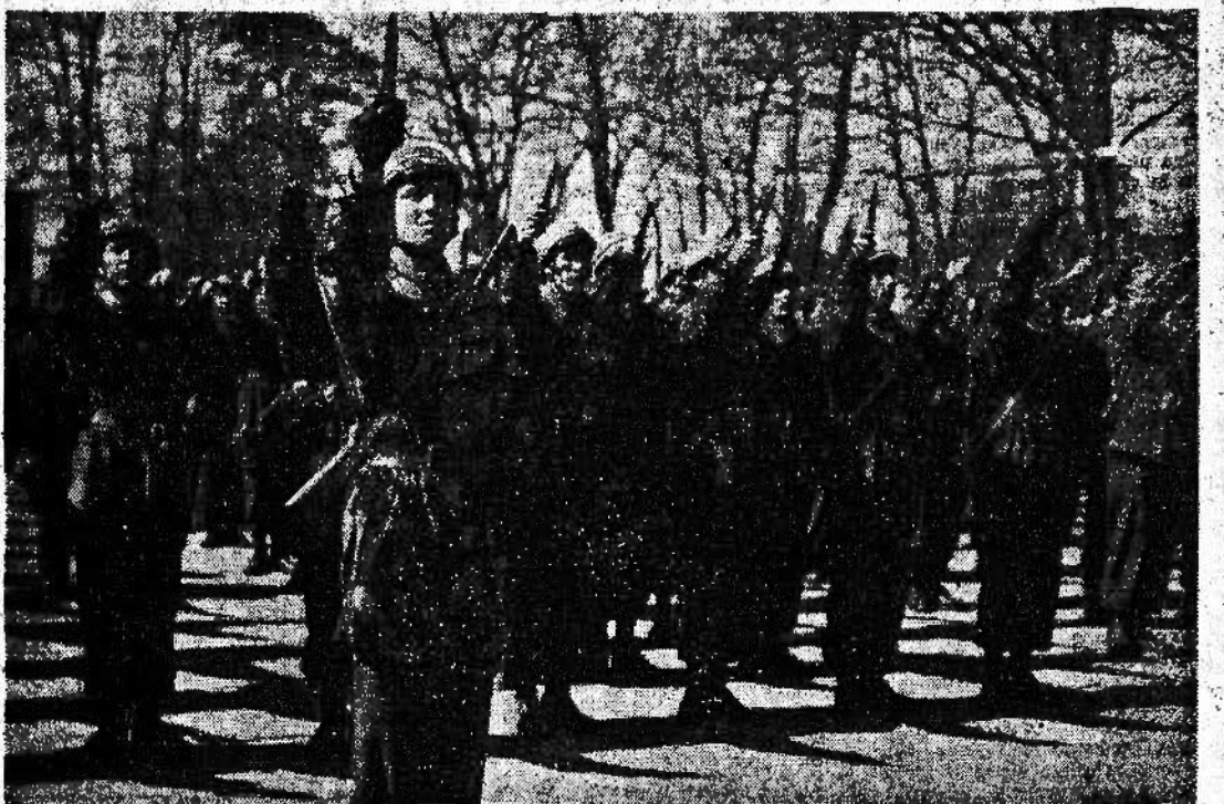
Un reparto di paracadutisti dell'Aeronautica repubblicana giura fedeltà alla bandiera