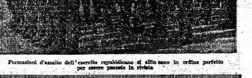
Formazioni d'assalto dell'esercito repubblicano si allineano in ordine perfetto per essere passate in rivista

a circa 7 chilometri dalla linea di confine. L'attacco sferrato