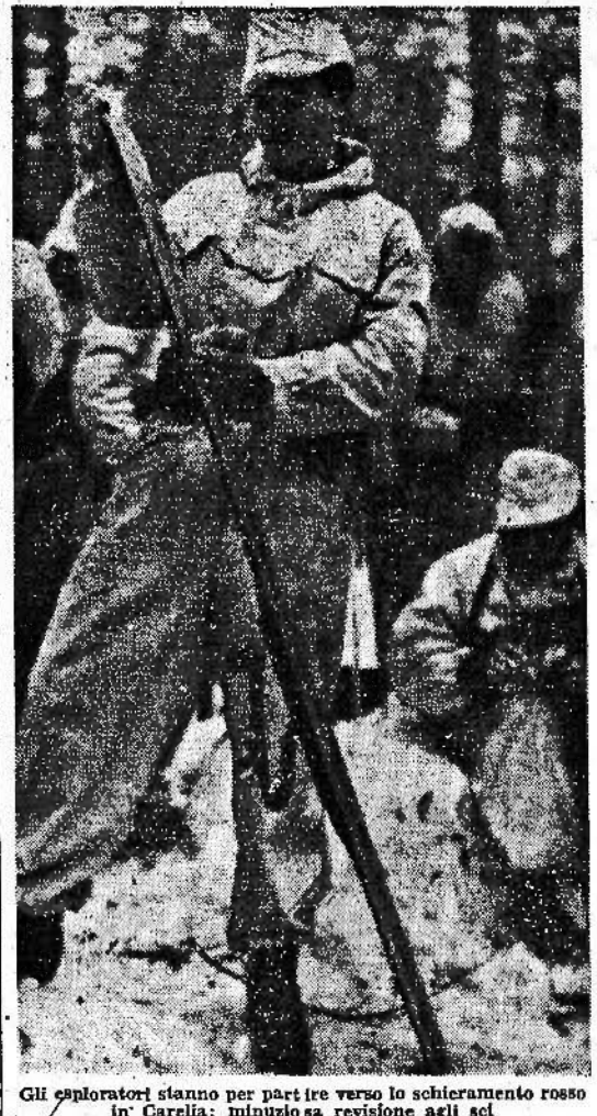
Gli esploratori stanno per partire verso lo schieramento rosso in Carelia: minuziosa revisione agli sci

Nella zona dell'Appennino centrale ed in quello adriatico si registra intensificata attività di pattuglie esploranti germaniche.