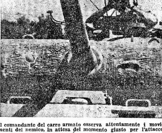
Il comandante del carro armato osserva attentamente il momento giusto per l'attacco

Berlino, 10 aprile. La battaglia difensiva nella zona della Ruhr si è notevolmente intensificata durante la giornata di domenica. A nord di Essen, gli americani, dopo gli inutili attacchi effettuati nelle prime settimane, sono riusciti a penetrare nella zona difensiva tedesca, dove tuttavia sono stati arrestati e circoscritti. Anche durante la giornata di domenica, l'offensiva in direzione di Dortmund non ha avuto alcun successo. Le forze che minime quadrato di terreno, più violenti di tutti: sono stati i gravi combattimenti per le strade nella parte nord della Ruhr. Un battaglione della 22. Divisione americana, trasportata, che era stato traghettato oltre il Reno a nord di Colonia, presso Hürtgen, è stato completamente distrutto. Nel settore del Sieg come pure su Monti Rothaar, i reparti della Armata nordamericana hanno subito di nuovo perdite di uomini straordinariamente alte, senza riuscire ad ottenere un successo di sorta.