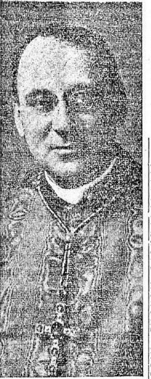
Il Cardinale G. B. Nasalli Rocca

La figura dell'Arcivescovo che da quasi cinque lustri regge la diocesi di Bologna