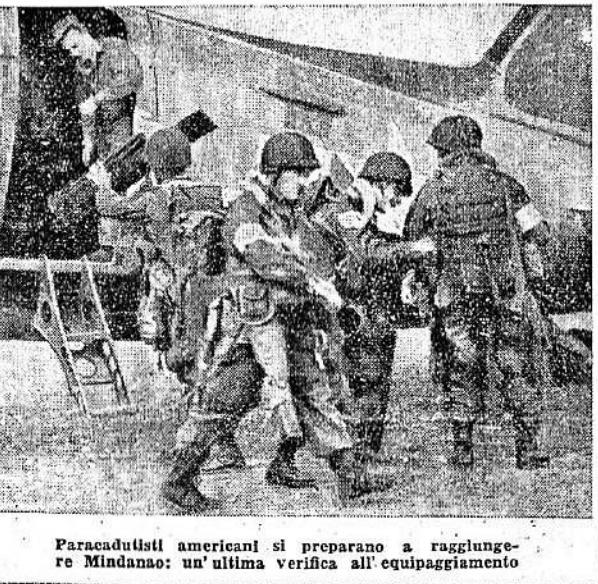
Paracadutisti americani si preparano a raggiungere Mindanao: un'ultima verifica all'equipaggiamento

Londra, 13 giugno. Un annuncio diramato contemporaneamente a Washington, a Mosca e a Londra reca: «Il commissario per gli Affari Esteri dell'U.R.S.S. Molotov, l'ambasciatore britannico Sir Archibald Clark Kerr e l'ambasciatore degli Stati Uniti W. A. Harriman, autorizzati dalle tre Potenze alleate a consultarsi con i membri del governo provvisorio polacco e con altre personalità democratiche attualmente in Polonia di pace all'estero, circa la riorganizzazione del governo provvisorio polacco di unità nazionale, si sono accordati affinché, per le suddette consultazioni previste nell'accordo di Crimea, vengano invitati i seguenti gruppi di persone: