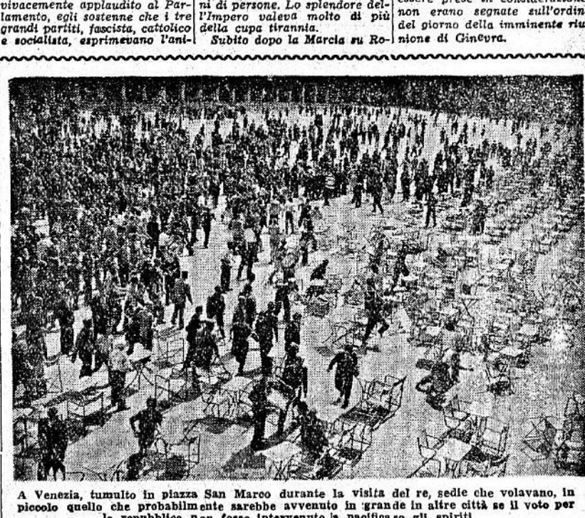
A Venezia, tumulto in piazza San Marco durante la visita del re, sede che volavano, in piccolo quello che probabilmente sarebbe avvenuto in grande in altre città se il voto per la repubblica non fosse intervenuto a pacificare gli spiriti.