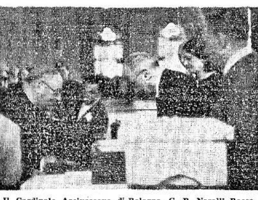
Il Cardinale Arcivescovo di Bologna, G. B. Nasalli Rocca consegna le schede al presidente del seggio elettorale nel Salone del Podestà in Piazza Re Enzo

Roma, 2 giugno. Gli elettori della Capitale e dell'Agro Romano sono circa un milione. Si prevede che oltre 800 mila affluiranno alle 1028 sezioni elettorali dislocate in città e fuori.