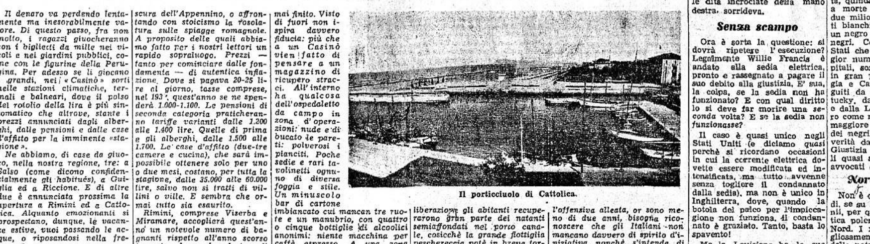
Il porticiuolo di Cattolica.

liberazione gli abitanti recuperano gran parte dei natanti semiandati nel porto canale, e, siccome la grande flottiglia peschereccia potrà in breve tornare in efficienza, i cantieri di costruzione ripresero immediatamente a funzionare. Per il lavoro, tanto che varie imbarcazioni di 300-350 tonnellate furono varate. Dovettero ripartire i lavori di ogni tipo, riassetto viari e giardini, ripulire facciate e pareti.