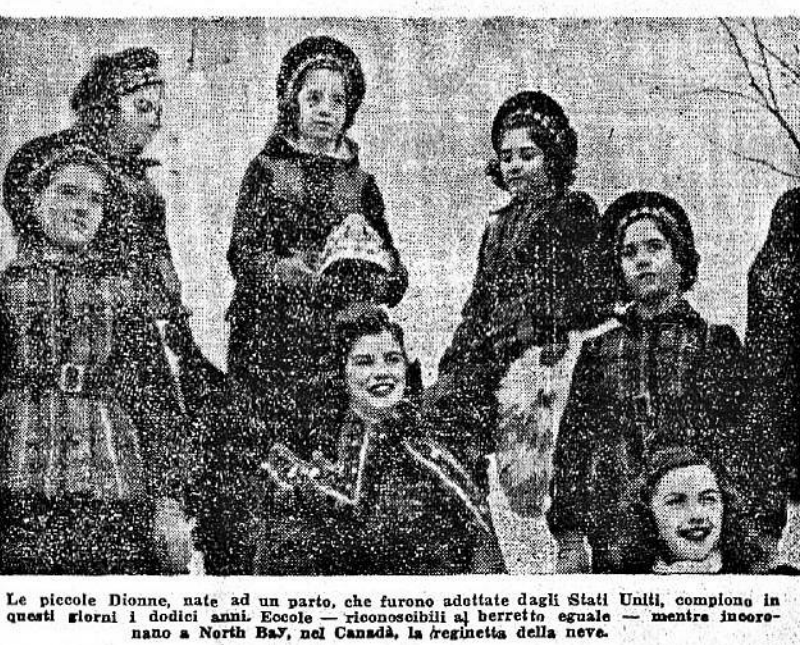
Le piccole Dionne, nate ad un parto, che furono adottate dagli Stati Uniti, compiono in questi giorni i dodici anni. Ecco le riconoscibili al berretto uguale — mentre incorenano a North Bay, nel Canada, la reginetta della neve.