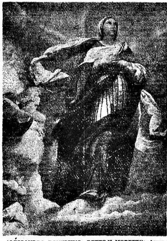
ALESSANDRO BONVICINO. DETTO IL MORETTO: Assunzione della Vergine dal Duomo Vecchio di Brescia